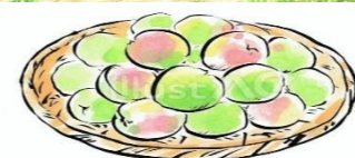
夏バテ防止に効果あり